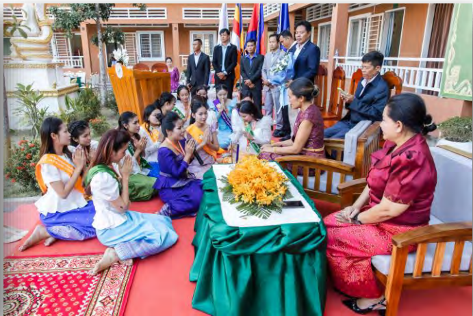
ការបោះឆ្នោតប្រចាំឆ្នាំជ្រើសរើសប្រធានក្រុមដឹកនាំ