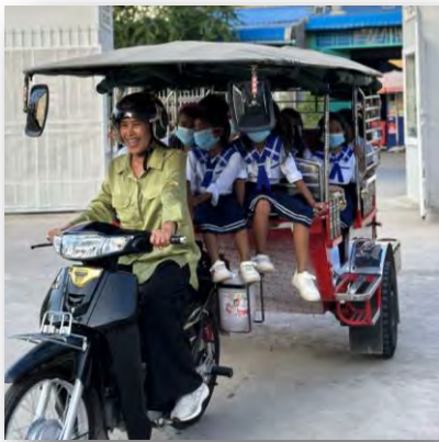
កុមារីសិក្សានៅសាលារដ្ឋ