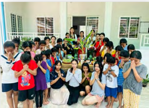
ការទទួលទេវតាឆ្នាំថ្មី