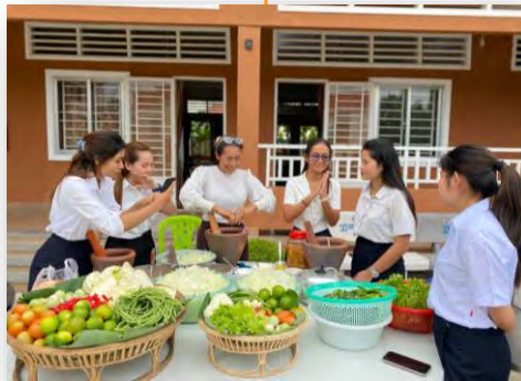
ធ្វើបុកល្ងង់